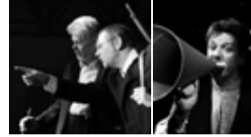
Abendveranstaltung im Kultursaal Horster Mitte