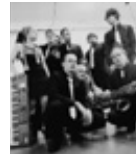
Kultursaal Horster Mitte